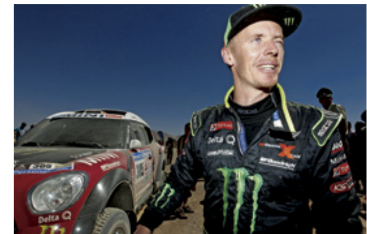
Chicherit, se ha convertido en pocos años en un reconocido piloto en el Rally Dakar.

más me gusta, el freeride. Esquí desde que tengo un año y medio, es mi vida, me he privado durante estos últimos cuatro años y ahora tengo unas ganas locas de esquiar a tope.